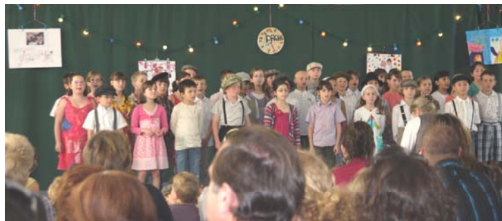
Spectacle de fin d'année

Bien d'autres sorties ont ponctué l'année : observation des rapaces nocturnes dans le bois du Ruel, visite de l'Arc de Triomphe, journée au château d'Auvers sur Oise pour les maternelles avec ateliers de collage ou de découverte de l'impressionnisme, visite du château fort d'Eaucourt où les enfants ont participé à plusieurs ateliers (du forgeron médiéval, de l'artisanat du cuir ou du vitrail, des bâtisseurs, des arbalétriers ).